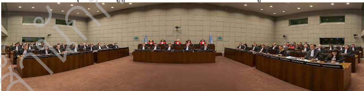
ภาพแสดงห้องพิจารณาพิพากษาคดีของศาลพิเศษสำหรับเลบานอน

ศาลพิเศษสำหรับคดีของเลบานอน ก่อตั้งขึ้นด้วยเหตุการณ์ที่มีเหตุระเบิดในกรุงเบรุตซึ่งเป็นเมืองหลวงของเลบานอน เมื่อปี พ.ศ. ๒๕๔๘ จากเหตุการณ์ในครั้งนั้นทำให้มีผู้เสียชีวิต จำนวน ๒๒ คน และมีผู้ได้รับบาดเจ็บรวม ๒๐๐ คน โดยหนึ่งในจำนวนผู้เสียชีวิตเป็นอดีตนายกรัฐมนตรีของเลบานอน นายราฟิค ฮารีรี สิ่งหนึ่งที่ทำให้ศาลแห่งนี้มีความน่าสนใจ คือ เป็นศาลที่มีการใช้ระบบการพิจารณาแบบผสม (Hybrid) กล่าวคือ การนำหลักกฎหมายอาญาระหว่างประเทศมาใช้ควบคู่กับกฎหมายภายในประเทศของเลบานอน และในปัจจุบันยังคงมีผู้ถูกกล่าวหาจำนวนมากที่ยังไม่ได้นำเข้าสู่กระบวนการพิจารณาคดี